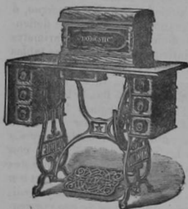
La máquina más elegante y más completa de todas.

La máquina más económica y la más cómoda que se ha inventado.