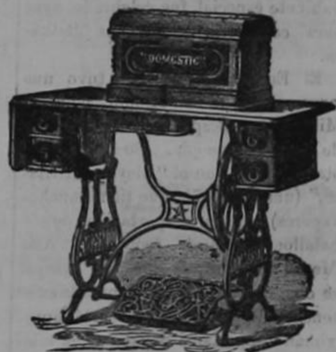
La máquina más ligera y útil para una familia.

Se pueden pedir todas las piezas sueltas y de repuesto para la máquina.